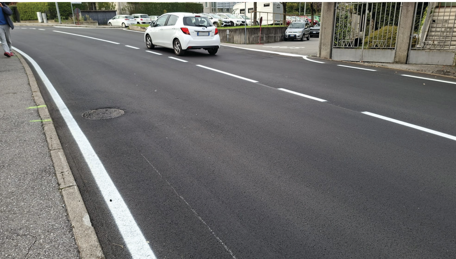
Foto: in alto un particolare di via per Bregazzana, qui sotto via Oriani